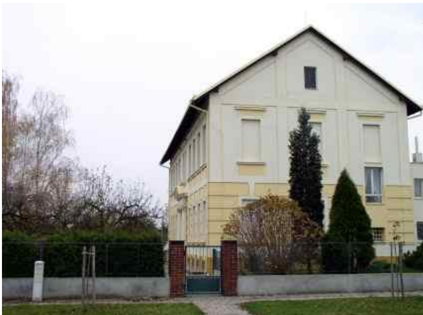
Budova MŠ Plačice